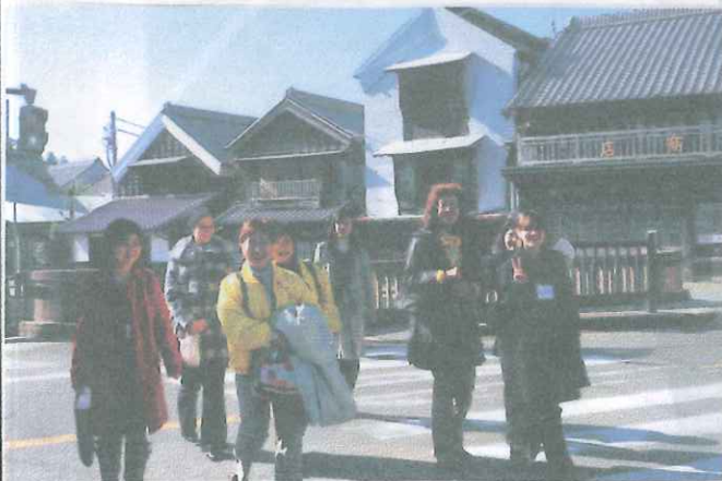
町を歩いて、英会話の実践

特に12月8日(水)に行われた最終回は、総復習ともいえるもので、講習会のあと町へ出て、実際にお店に立っていただき、講師から色々な質問を受けて英会