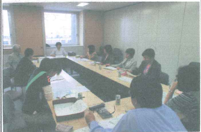
(総会へむけて話し合う正・副部会長会議、5/11)

これに先立ち、理事会を開きますので、理事の方々のご出席をお願いいたします。総会終了後には、市内旧NTT跡地にある「ロテスリー吉庭」にて懇親会を行います。多数の方々のご出席をお願いいたします。