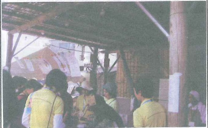
「復興佐原へ」イベントのお手伝いをする会員たち

香取市災害義援金を集めることを目的として、投げ銭方式で市民の応援をお願いするためのイベントでした。午後5時から8時まで、物品販売の他、佐原の伝統芸能である「佐原囃子」を中心に様々な余興をあわせて披露され、参加者を喜ばせました。