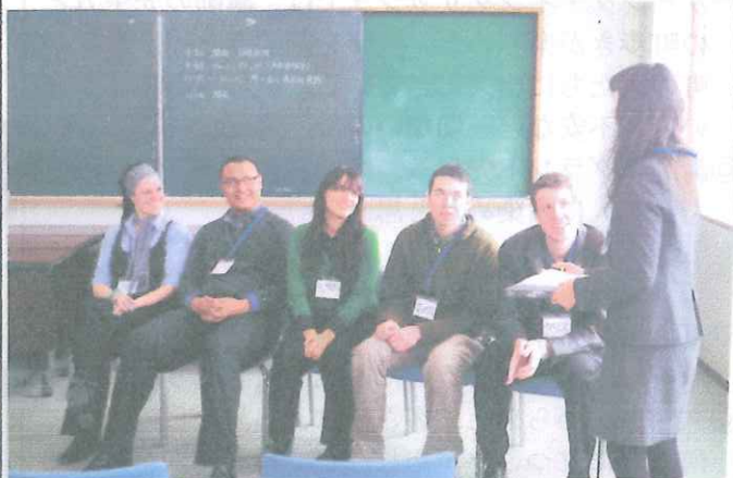
成田空港会社より派遣の講師のみなさん