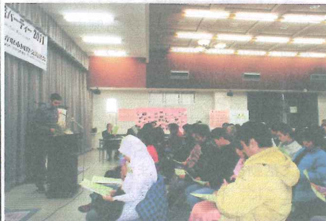
(上) 沢山の参加者を前に日本語を披露 (日本語スピーチコンテスト)