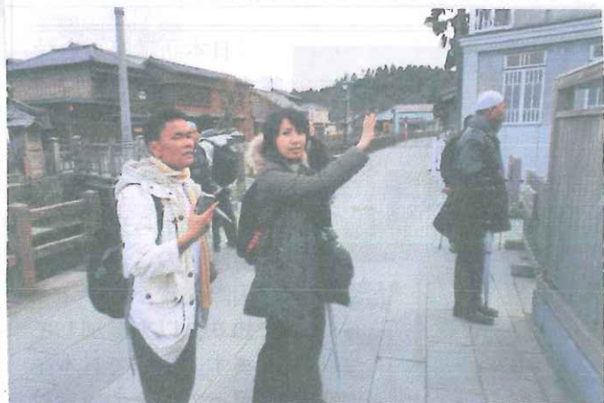
スマトラからのお客様が日本建築に強い関心